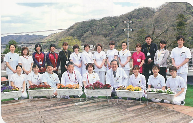
緩和ケア病棟スタッフ

緩和ケア認定看護師を配置し、より一層専門性の高い看護実践できるよう努力してまいります。患者さまとそこそご家族の価値観を尊重し、権利を擁護し自己決定を尊重した緩和ケアを実践していきます。