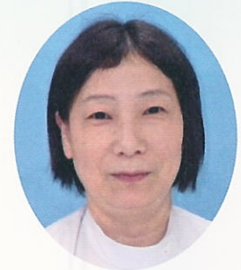
副院長兼看護部長

当院の緩和ケア病棟は、6床という小さな病棟です。患者さまの痛み、食欲不振などの身体苦痛を緩和し、不安・悩みなどの精神的苦痛を和らげる心のケアを行うことを目的にしています。