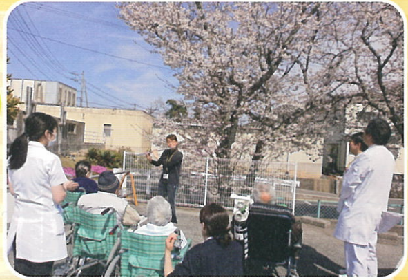
桜とフルーツの音色に、皆癒されました