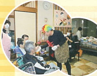
今年の鬼は人懐っこいぞ☆