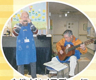
心地よいメロディーに 安らぎます♪