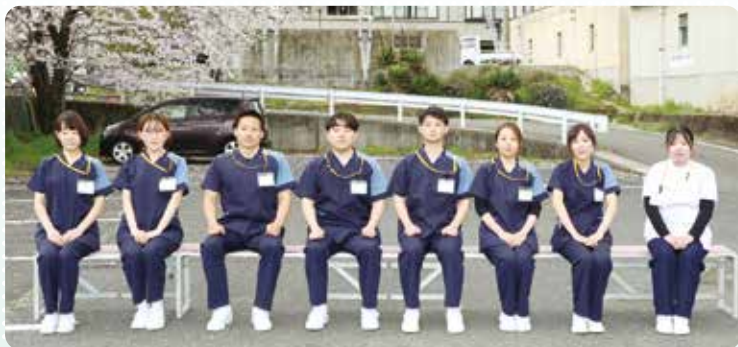
令和8年度 新採用職員